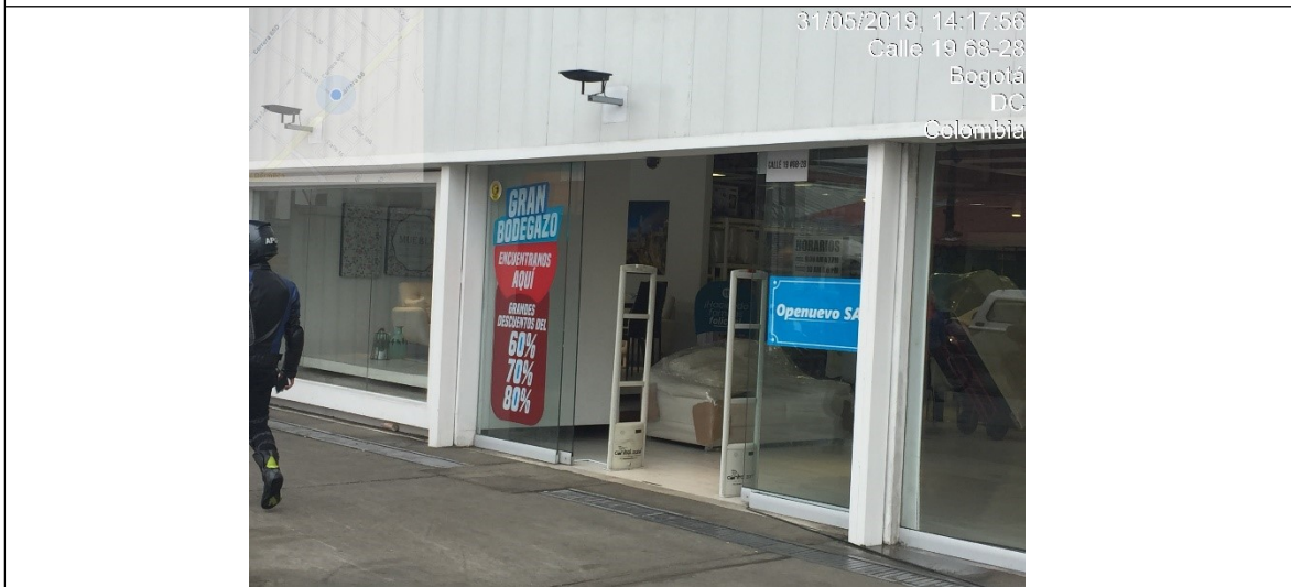
Fotografía panorámica de la fachada 1 del establecimiento de comercio PUNTO DE VENTA 1, cuenta con avisos pintados o incorporados en cualquier forma a las ventanas o puertas de la edificación.