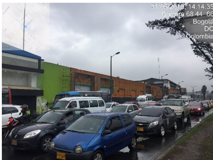
Fotografía panorámica de la fachada 2 del establecimiento de comercio PUNTO DE VENTA 1, no cuenta con elementos de Publicidad Exterior Visual.