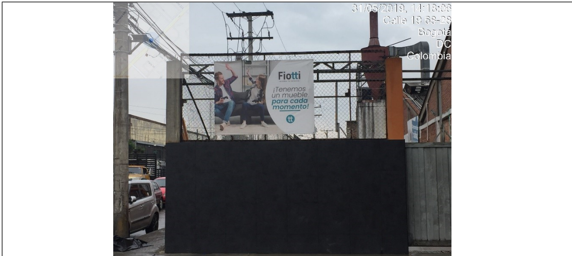
Fotografía panorámica del establecimiento de comercio PUNTO DE VENTA 1, el establecimiento cuenta con más de un aviso por fachada.

ALCALDÍA MAYOR DE BOGOTÁ D.C. SECRETARÍA DE AMBIENTE